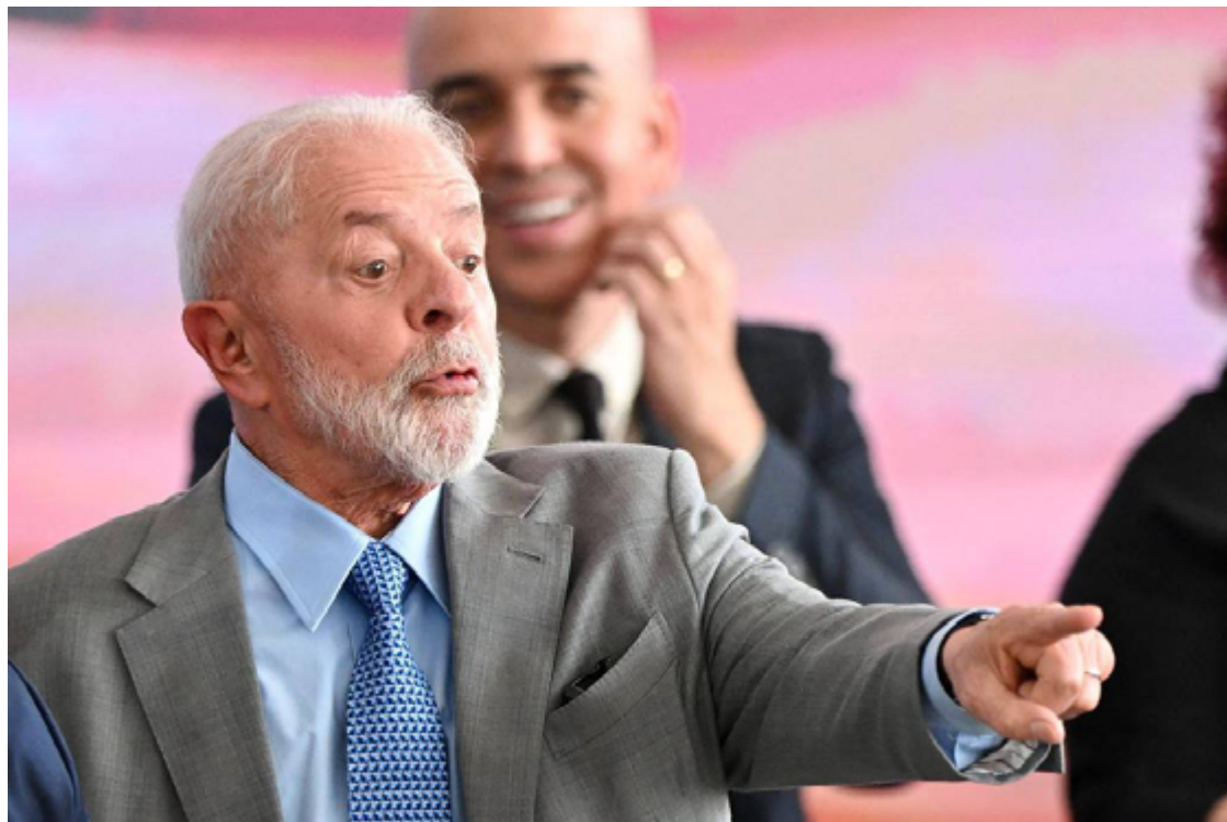
Lula da Silva: nenhuma contribuição Elon Musk ofereceu ao desenvolvimento do Brasil

Além de dono do X e da fabricante de veículos elétricos Tesla, Musk também é fundador da Space X, que desenvolveu avanços tecnológicos como a capacidade do foguete Falcon 9 de retornar ao solo e planos