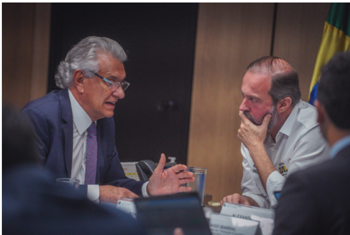
Ronaldo Caiado durante audiência com ministro de Minas e Energia, Alexandre Silveira: falta de energia atrapalha crescimento de Goiás

Crítico do sucateamento e venda da Celg para a Enel, o