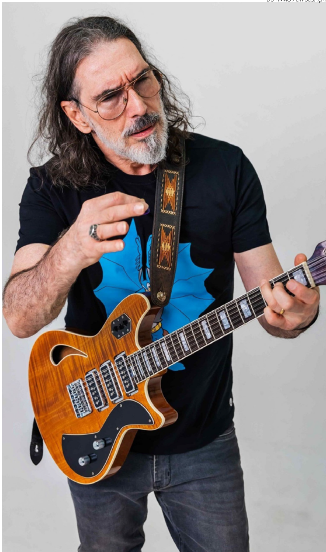
Músico debutou no cenário cultural brasileiro há cinco décadas