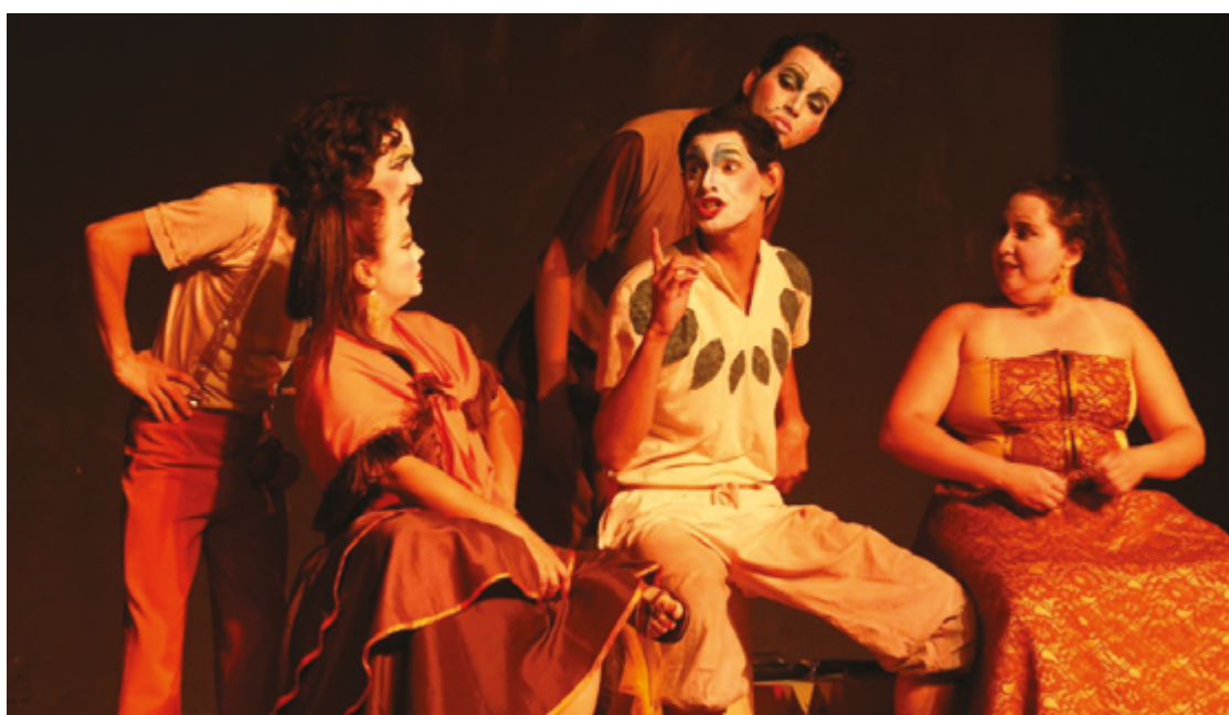
Programação apresenta ao público a qualidade técnica e profissional dos integrantes da Escola de Teatro de Anápolis