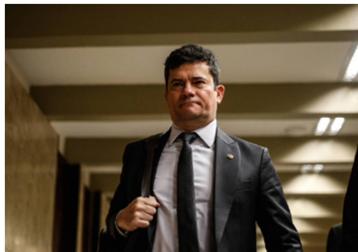
Sergio Moro: mandato mantido na Justiça do Paraná