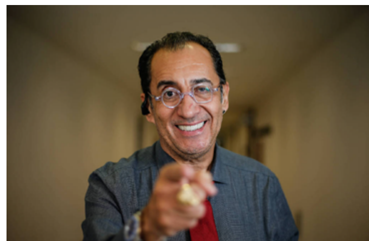
Jorge Kajuru: empresa será investigada pela CPI das Apostas

Ele também afirma que a partir de agora, por presidir a CPI, não fará mais propaganda pessoalmente desta bet ou de qualquer outra.