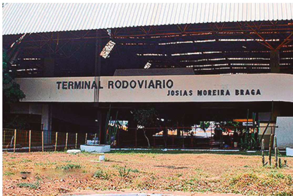
Terminal foi devolvido pelo Estado para a gestão da Prefeitura Municipal e agora passa por modificações

um espaço muito grande e não utilizado. E também temos na área externa, que também pode ser aproveitada para um projeto de expansão devido ao potencial que aquela região tem. Você tem a Avenida Brasil de um lado, você tem a Avenida Ana Jacinta de outro. Então o potencial de crescimento é grande. Prova disso é o shopping [ao lado] que concentra uma quantidade imensa de pessoas.