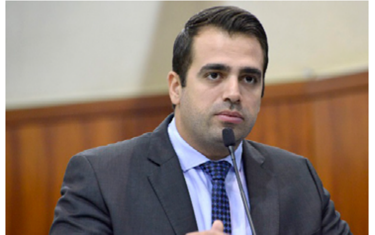
Gustavo Sebba: à frente do PSDB de Goiás