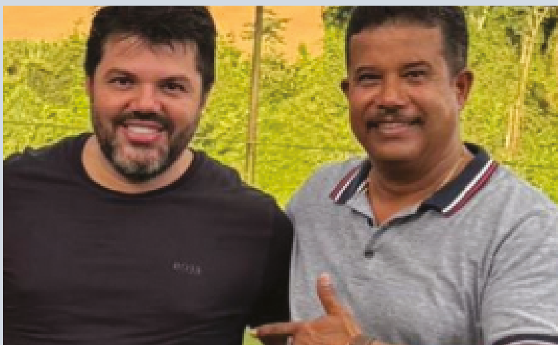
Coronel Adailton havia anunciado apoio ao pré-candidato Márcio Corrêa, até a direção nacional apontar para apoio ao PT

Mas, nas últimas semanas, seu partido, o Solidariedade, negociou, no âmbito nacional,