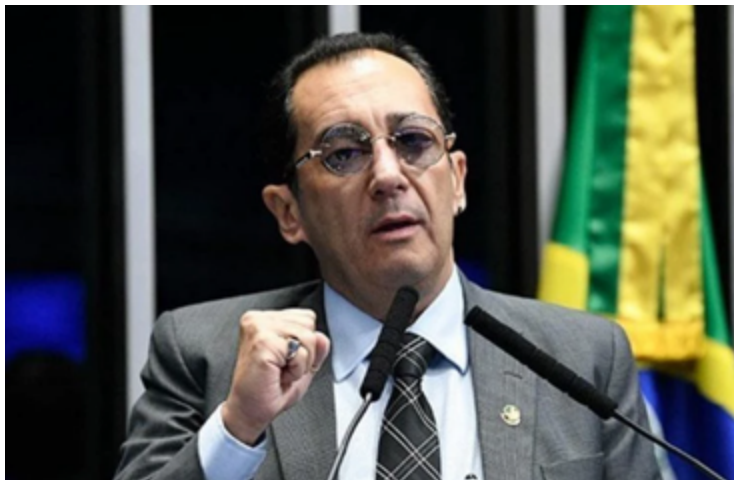
Jorge Kajuru: defesa do fim da reeleição