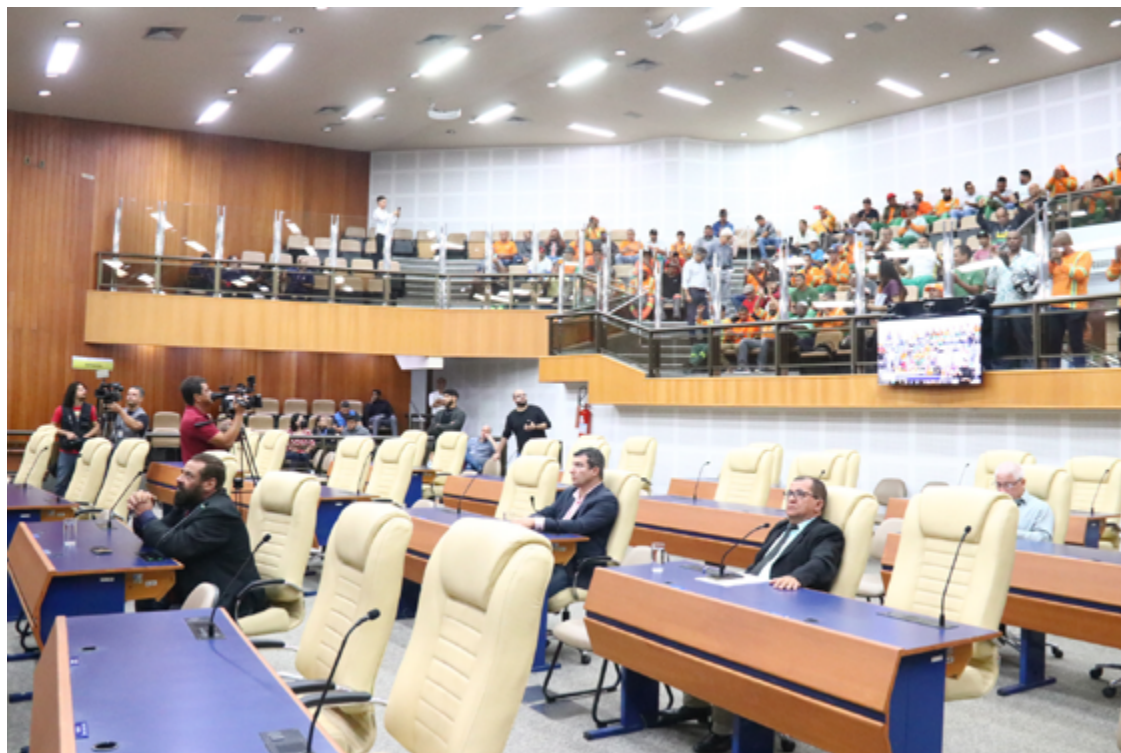
Câmara Municipal de Goiânia: novas bancadas de vereadores