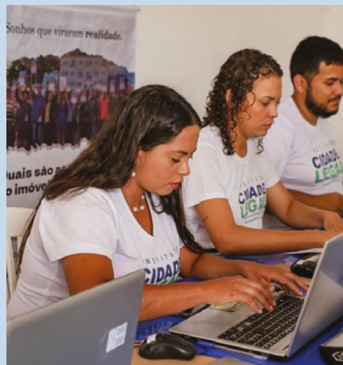
Regularização Fundiária Social já realizou mais de 2,8 mil atendimentos

Estão aptos a participar do processo moradores que ocuparam áreas irregulares até 2016 cuja renda familiar mensal não ultrapasse cinco salários mínimos. Ao fim do processo, a família recebe, sem custos, a Certidão de Regularização Fundiária. Para ser contemplada com a Reurb-S, a família não pode ter participado de nenhum programa habitacional, a exemplo do Meu Lote, Minha História, atualmente em andamento no município. A Prefeitura fará o levantamento cadastral das unidades imobiliárias e a atualização dos dados socioeconômicos das famílias. Além dos mutirões de cadastro, será feito agendamento para visita e uma equipe irá a cada local para aferição de dados.